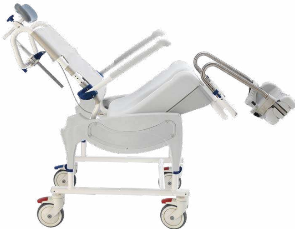
▲ Ocean VIP Ergo mit Sitzwinkelverstellung