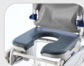
Sitzfläche und Rückenlehne