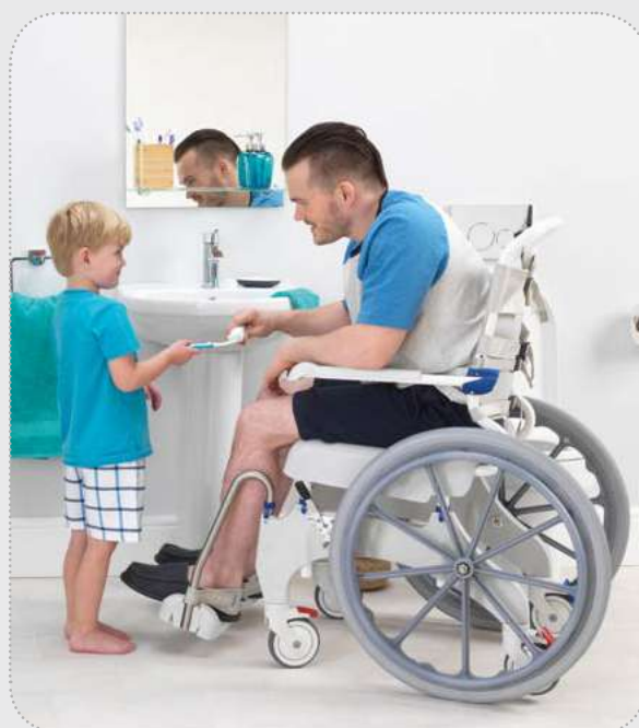
Ocean Ergo mit 24“-Rädern