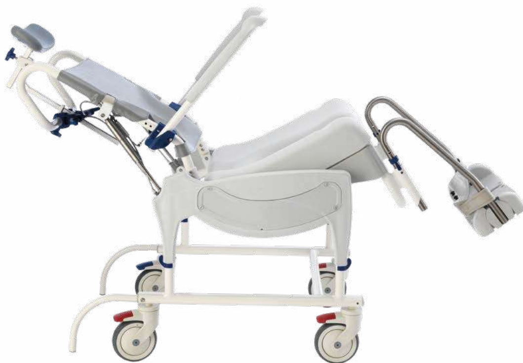
▲ Ocean Dual VIP Ergo mit Sitz- und Rückenwinkelverstellung